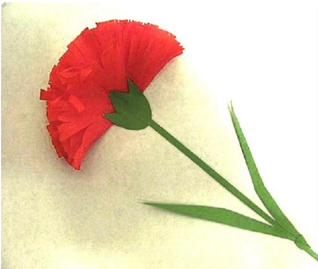
Готовая бумажная гвоздика (распустивший цветок)

6. Вырежьте из зеленой бумаги стебелек с чашечкой и листиком