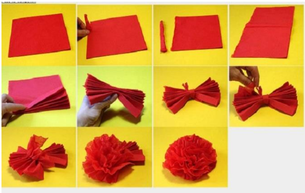
Основные этапы формирования гвоздики из салфетки