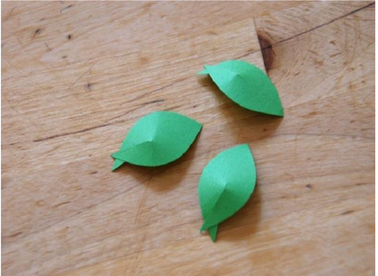
Объемные листики для аппликации