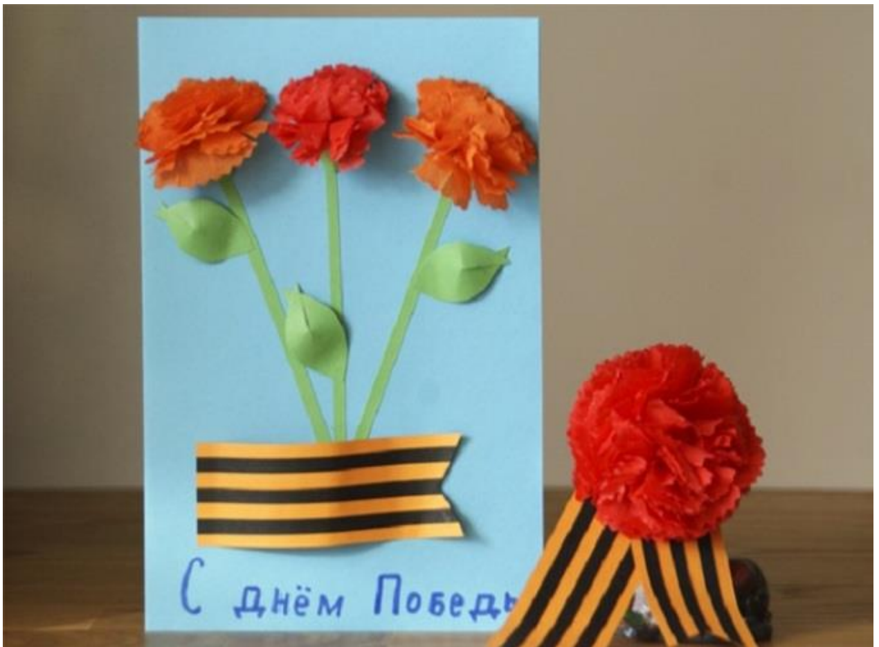
Пример детской открытки у к 9 мая «Цветы Победы»Пример детской открытки к 9 мая «Цветы Победы» с поздравительным текстом