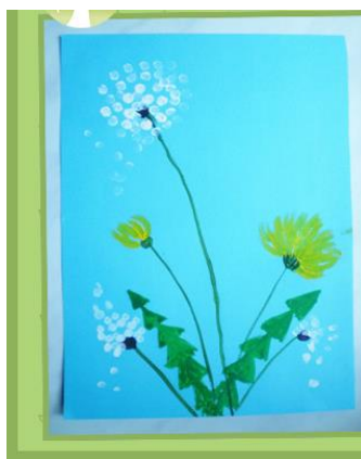
Рисунок готов! Удачи вам в творчестве !

5. Слегка обмакнуть противоположную сторону палочки в желтую краску и легким нажимом на неё нарисовать желтые лепестки одуванчика. Движение палочки идет от сердцевины с нажимом и постепенным отрывом.