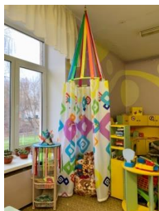
Центр уединения «Моё настроение»

Центр уединения оснащен закрытым шатром, креслом – мешком, этажеркой для хранения атрибутов, дидактических и сенсорных игр.