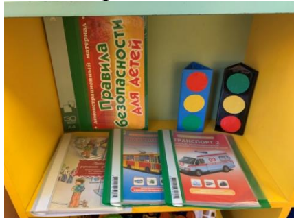
Мини центр «Безопасность»

Игровой центр (сюжетно-ролевые игры, строительные игры и др.) Игровой центр оснащен игровыми мебельными модулями: кухонный гарнитур, парикмахерская, больница, магазин, обеденным столом и табуретками, двух ярусной кроватью со шкафом для одежды, тумбой с полками.