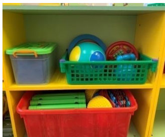
Центр физической активности

Центр двигательной активности оснащен мебельным модулем для хранения спортивного инвентаря, содержащим в себе как традиционное физкультурное оборудование, так и нетрадиционное (нестандартное, изготовленное руками педагогов и родителей).