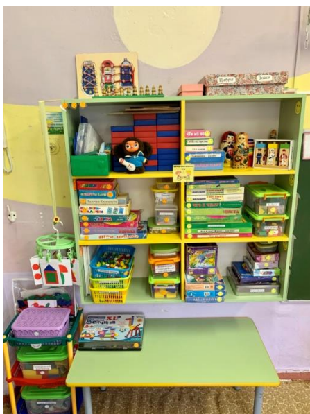
Мини центр настольно-печатных игр

Центр познавательной активности разбит на мини центры: (мини центр настольно-печатных и развивающих игр (математические и речевые), мини центр науки (природы и экспериментирования), центр патриотического воспитания. Центр познавательной деятельности оснащен мебельным стеллажом, полкой для хранения пособий, дидактических игр.