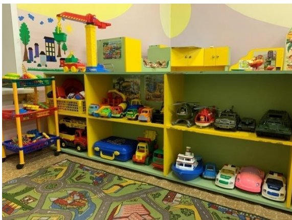
Мини центр строительных игр

Игровой центр (сюжетно-ролевые игры, строительные игры и др.) Игровой центр оснащен игровыми мебельными модулями: кухонный гарнитур, парикмахерская, больница, магазин, обеденным столом и табуретками, двух ярусной кроватью со шкафом для одежды, тумбой с полками.